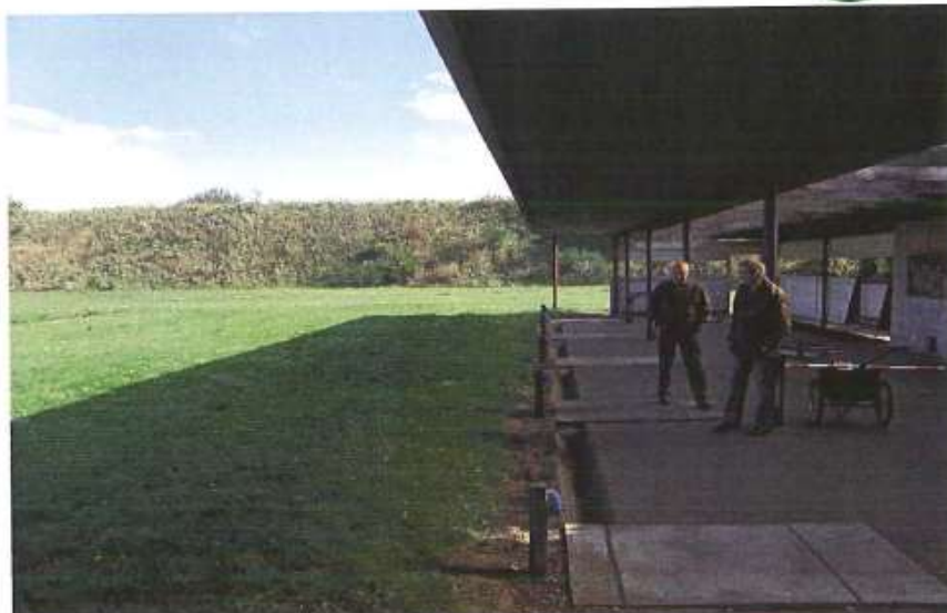
Olympisk trapbane med jordvold i baggrunden.