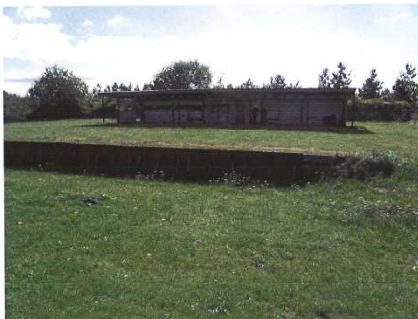
Foto nr. 6, olympisk trapbane med maskinhus i forgrunden.