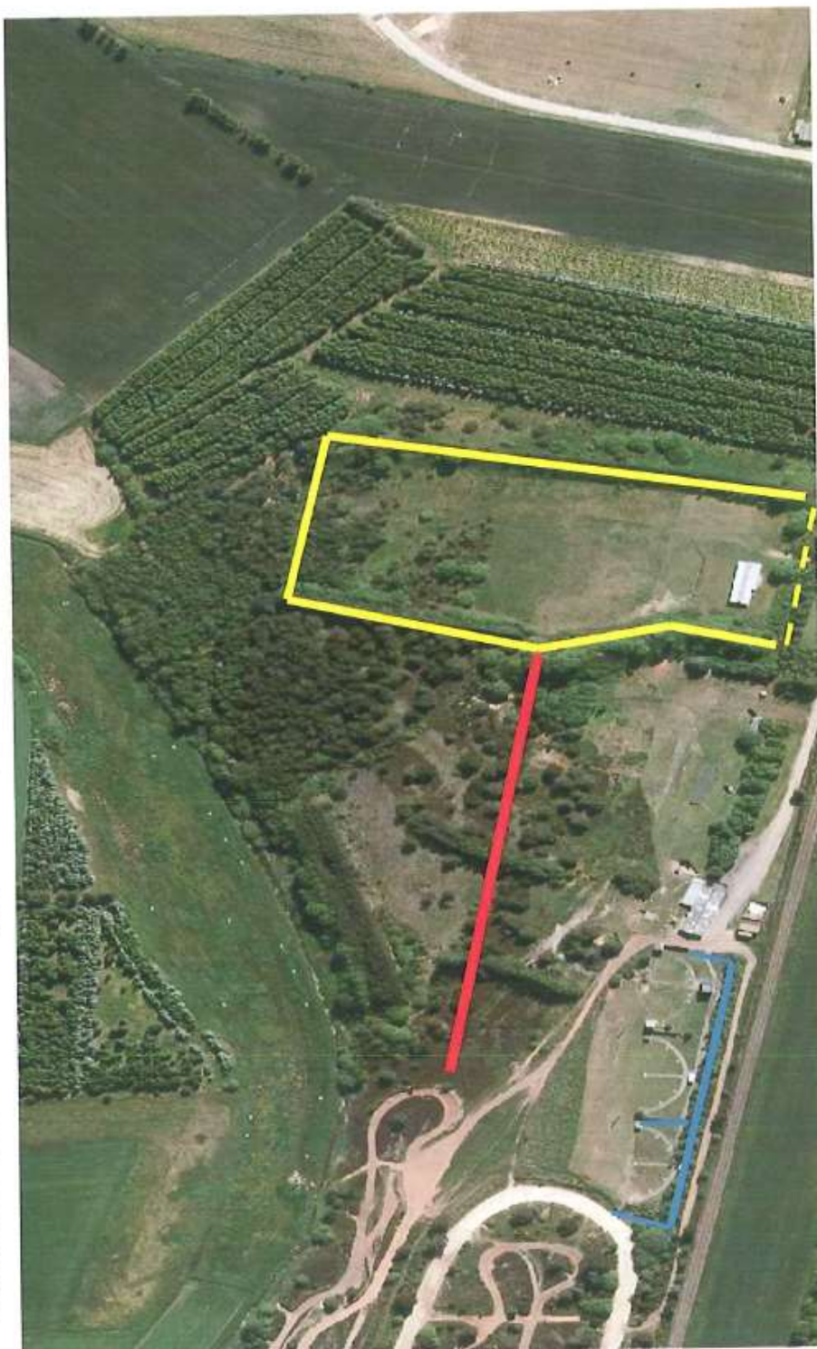
Skitse, ikke målfast.